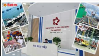
Quảng Ninh triển khai đồng bộ Nghị quyết 68 tạo xung lực mới cho kinh tế tư nhân.

▶ [QUẢNG NINH] Quảng Ninh đang triển khai Nghị quyết 68-NQ/TW theo hướng đồng bộ, có trọng tâm. Cụ thể, tỉnh kiên toàn Ban Chỉ đạo, cụ thể hóa mục tiêu - nhiệm vụ, đẩy mạnh cải cách thủ tục hành chính và hỗ trợ doanh nghiệp tiếp cận vốn, đất đai, nhân lực. Nhờ đó, môi trường đầu tư được cải thiện rõ rệt, kinh tế tư nhân tăng nhanh về số lượng và chất lượng, đóng vai trò trụ cột trong tăng trưởng, thu ngân sách và tạo việc làm của tỉnh. ( Link )